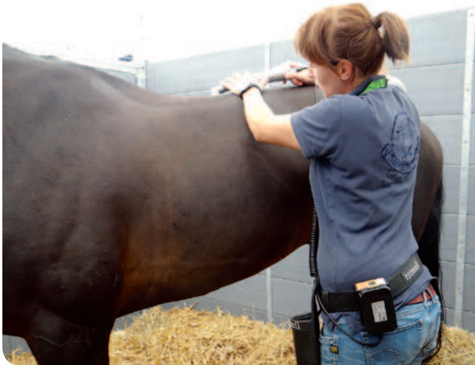
Mit hochmodernen Geräten und wissenden Händen kümmern sich Physiotherapeuten um ihre Pferde-Patienten.

dizinische Grundausbildung abgeschlossen ist, ist es sinnvoll sich an Schulen zu wenden wo sich die Ausbildungslänge mindestens über ein Jahr und länger ausdehnt und mit einer zertifizierten Abschlussprüfung endet.“ Das berufliche Zukunftsbild, dass die Fachfrau vom Physiotherapeuten für Pferde